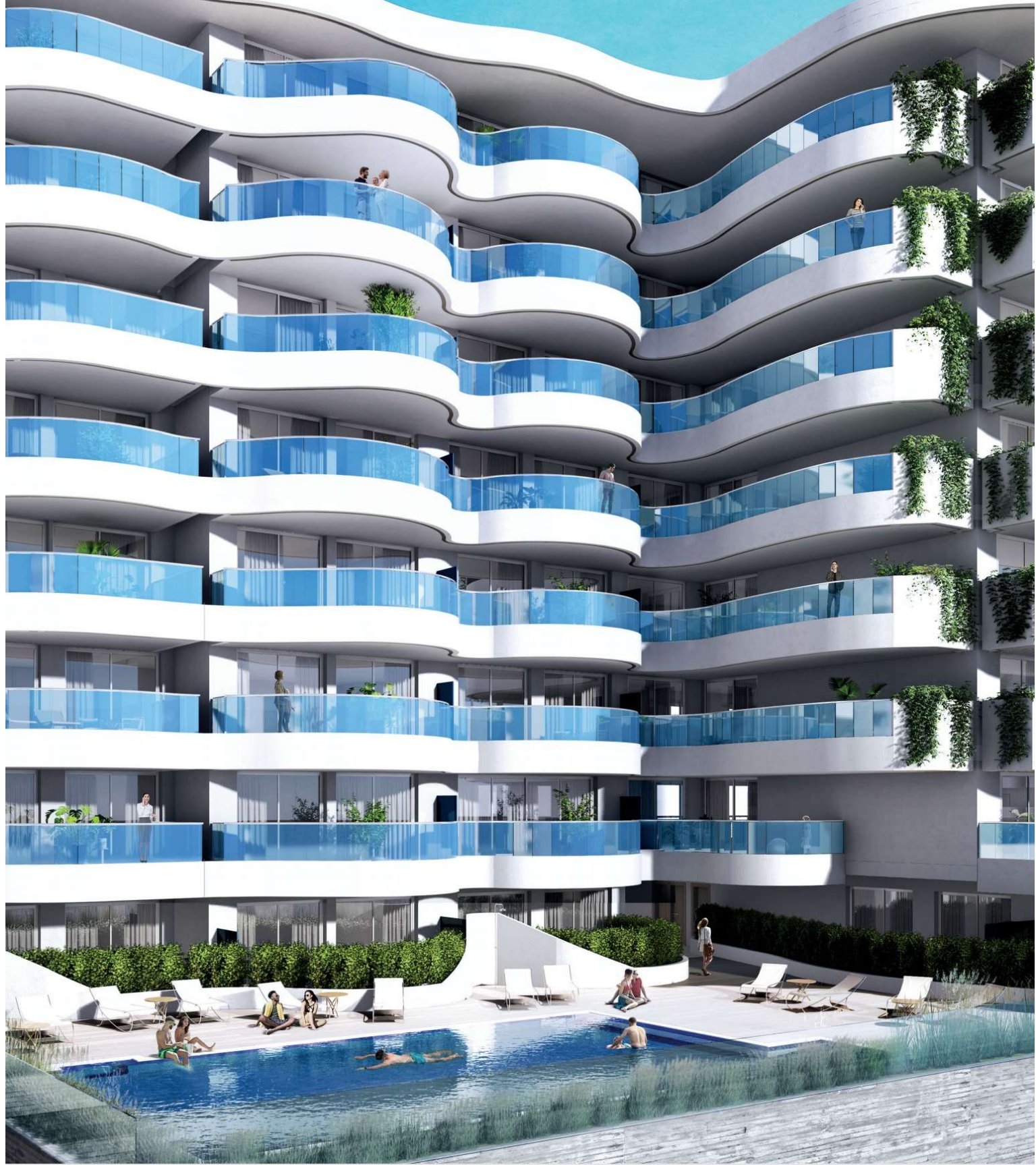
PISCINA EXTERIOR PARA ADULTOS