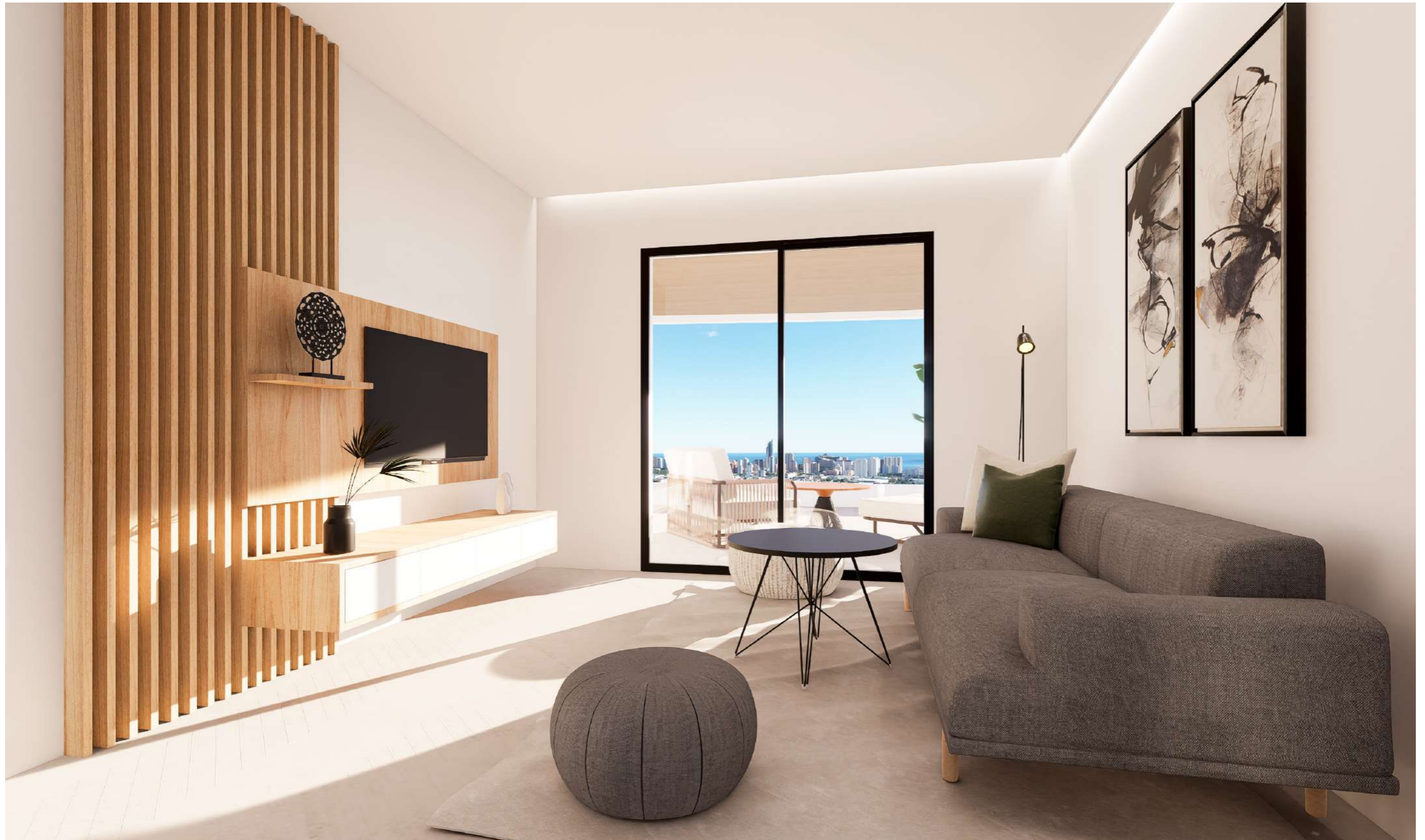
Salones con acceso directo a terraza privada y solárium. Vistas al entorno natural de Finestrat con vistas al mar y a la montaña.